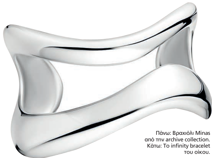
Πάνω: Βραχιόλι Minas από την archive collection. Κάτω: Το infinity bracelet του οίκου.