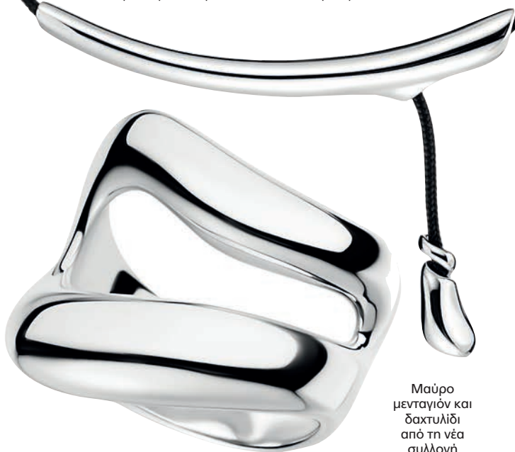
Μαύρο μενταγιόν και δαχτυλίδι από τη νέα συλλογή του οίκου.

«Το αγαπημένο μου είναι ένα σχέδιο του Μηνά, ένα βραχιόλι εμπνευσμένο από τις πτυχώσεις στα ρούχα των αρχαίων ελληνικών αγαλμάτων. Το να δίνω ζωή στα σχέδια του πατέρα μου μού τον θυμίζει έντονα».